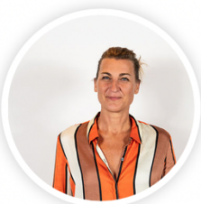
Barbara de Loor Wereldkampioene schaatsen 2005