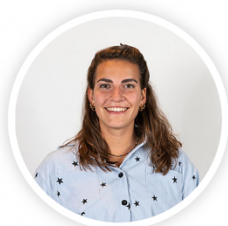
Frédérique Matla Hockey international