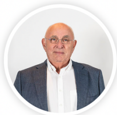
Michael van Praag Sportbestuurder

Lees hier het interview met onze nieuwste ambassadrice Monique Velzeboer.