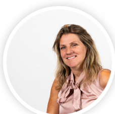
Monique Velzeboer Olympisch kampioene 1988